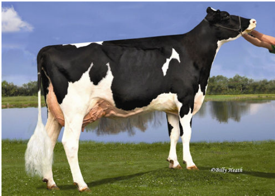
KY-BLUE GW DANA FIFTH DAM