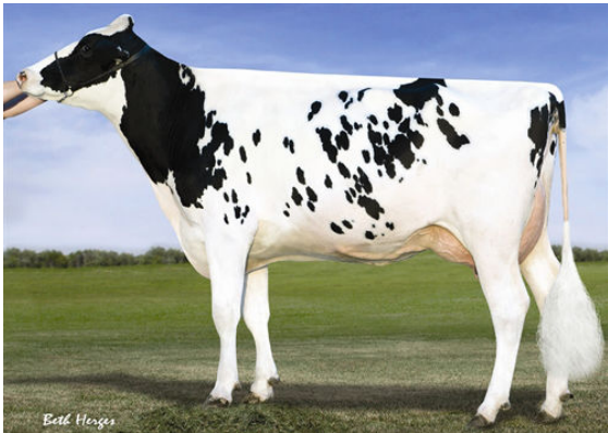
VISION-GEN SH SHO A12037 FOURTH DAM